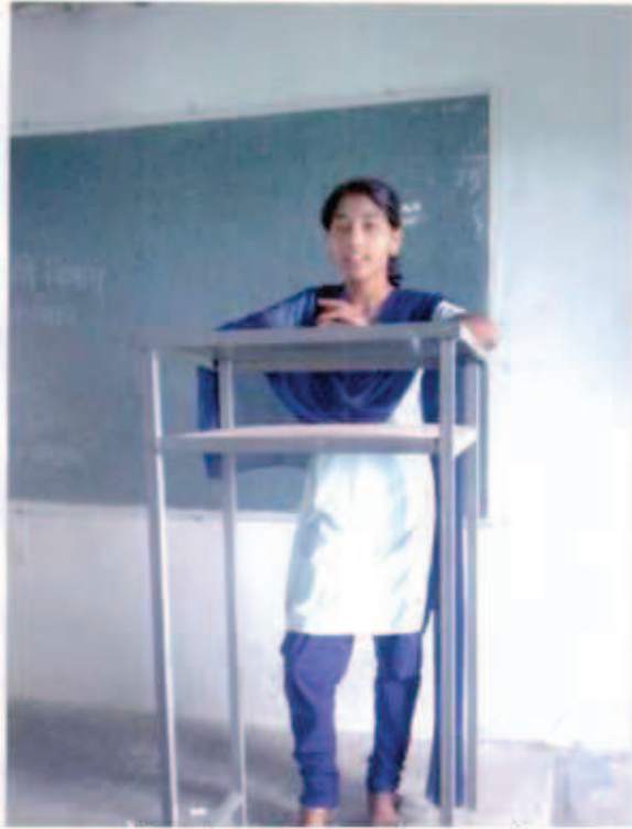
दिनांक : २७/०८/२०१७ मध्ये आपले मत मांडताना विद्यार्थीनी