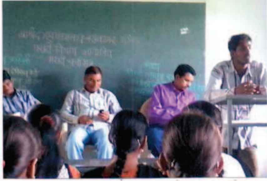
दिनांक : २७/०८/२०१७ मध्ये आपले मत मांडताना विद्यार्थी